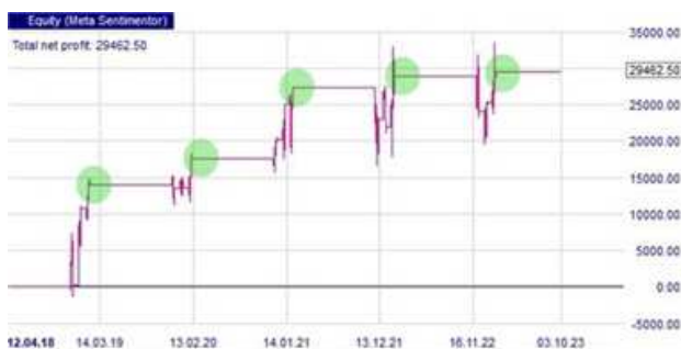
Monatsende-Effekt (Nov.-Jan. – 2018-2022)