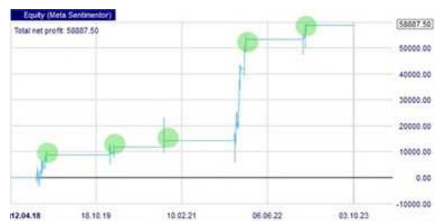
Turnaround Tuesday (Nov.-Jan. – 2018-2022)